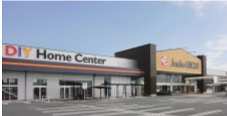
静岡県を中心にDIY店を展開するエンチョー。写真はジャンボエンチョー www.encho.co.jp

ホームセンター業界向けの情報システムを提供するIT企業。エンチョーグループのシステム企画・開発・構築・運用を手がける他、グループ外にも業務改革支援サービスや小売業向け総合パッケージの販売、ASPサービスの提供、業務支援ソリューションの提供などを行っている